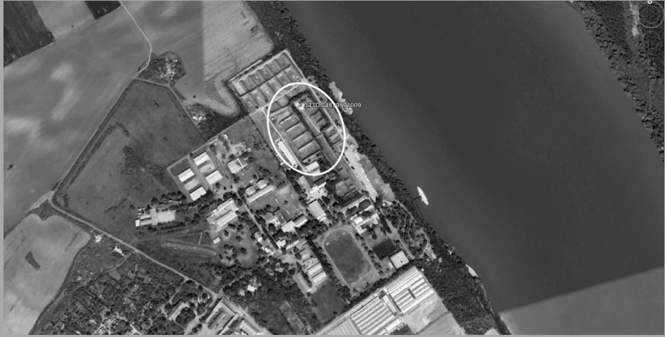
Srbija, Lake 34TDQ6848769190