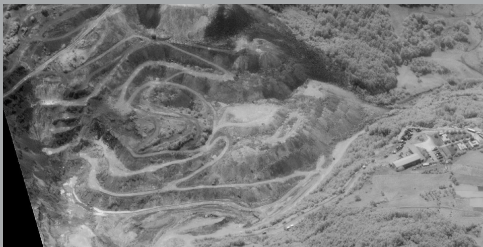
Srbija, Petrovo selo 34TFQ1372143560