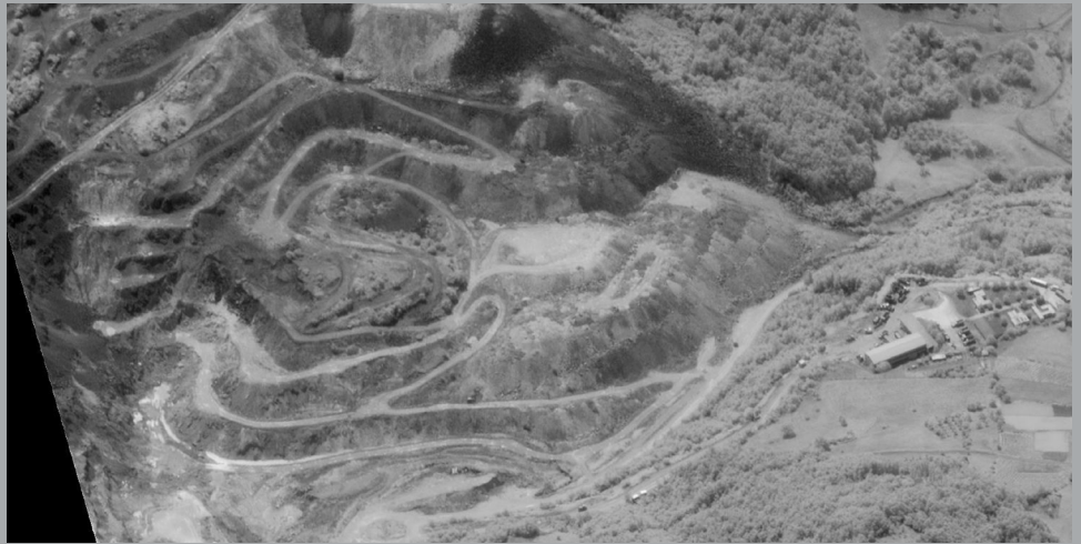
Serbia, Petrovo selo 34TFQ1372143560