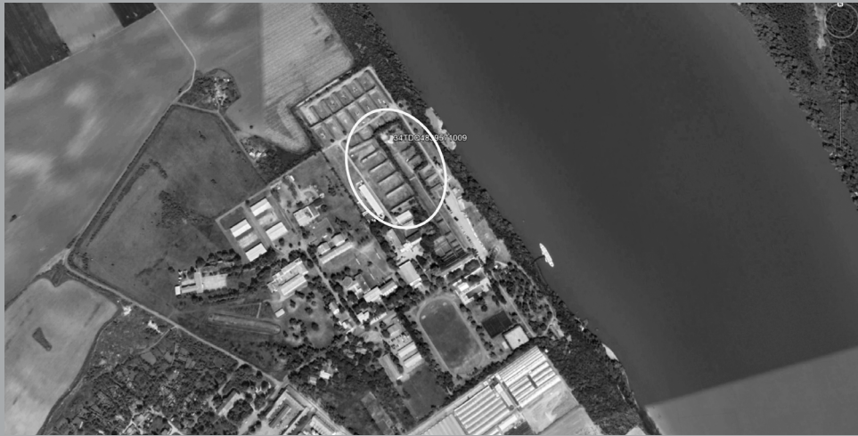
Serbia, Lake 34TDQ6848769190